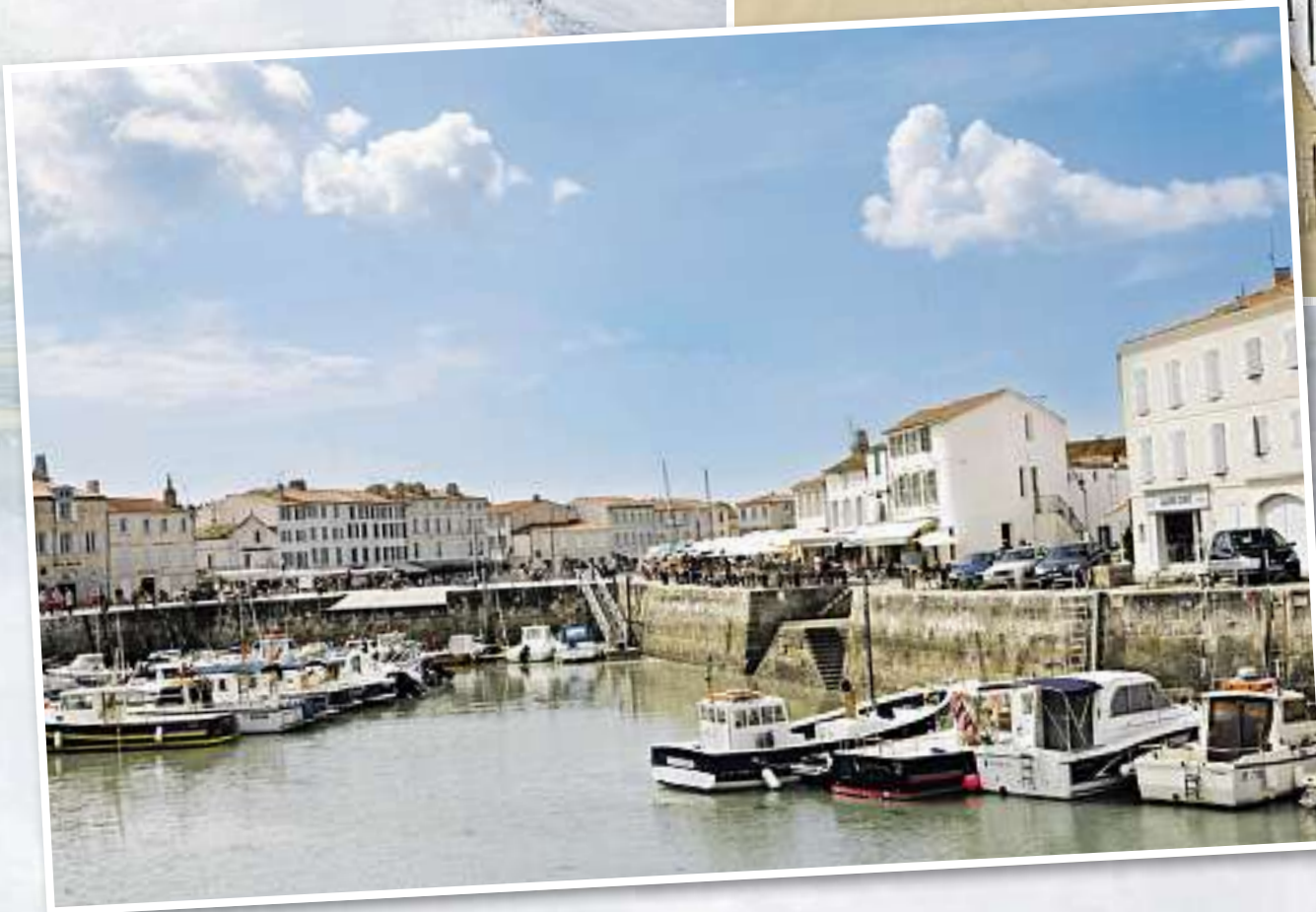
Darling des Jets: Die Ortschaft Saint-Martin-de-Ré ist eines von zehn Dörfern auf der Atlantikinsel Ré.

Caupenne ist 60 Kilometer vom Meer und 615 Kilometer von Paris entfernt, was im zentralistisch regierten Frankreich eine wichtige Angabe ist.