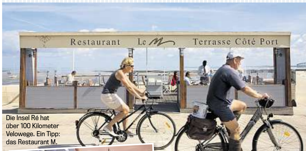
Die Insel Ré hat über 100 Kilometer Velowege. Ein Tipp: das Restaurant M.