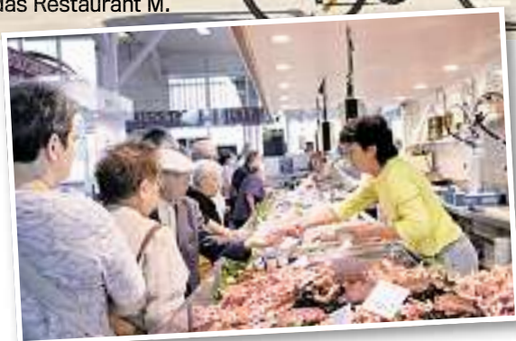
Ein Muss bei einem Besuch in La Rochelle: Der Markt ist ein wahres Schlaraffenland.

chitekten Vauban vor der Inselhauptstadt Saint Martin, seit gut einem Jahr auf der Liste des Unesco-Weltkulturerbes, kann gratis besichtigt werden. Hier befindet sich auch der grösste Arbeitgeber der Region: das Gefängnis.